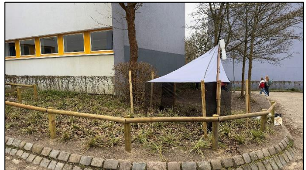
Ungewohnter Anblick: Malaisefalle im Siedlungsraum

Zudem werden in Kürze auch die Fallenfelder auf Neuwerk und Scharhörn wieder in Betrieb genommen, wo wir auf die Besetzung der Vogelstation angewiesen sind.