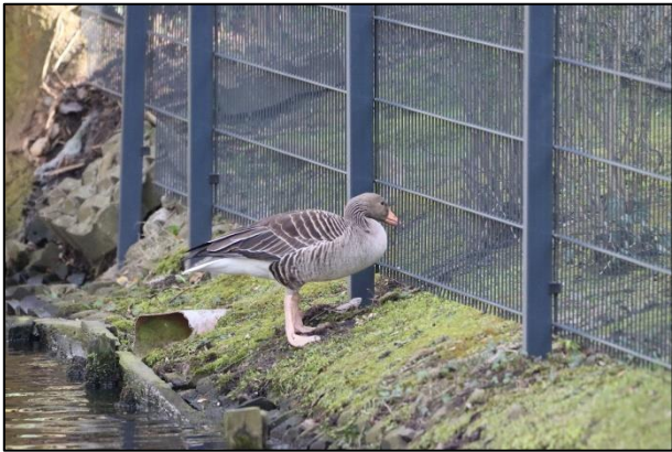
Einer der letzten zugänglichen Gärten am Leinpfadkanal wurde 2022 umzäunt

Meist sind solche Maßnahmen beim Eigentümerwechsel zu beobachten. Dadurch gehen teilweise jahrelange wertvolle Rückzugsorte für Wasservögel und ihren Nachwuchs plötzlich verloren und die verbliebenen zugänglichen Gärten werden umso intensiver genutzt; so entsteht oft der Eindruck es werden mehr. Immer nur weg geht nicht, irgendwo müssen sie ja hin.