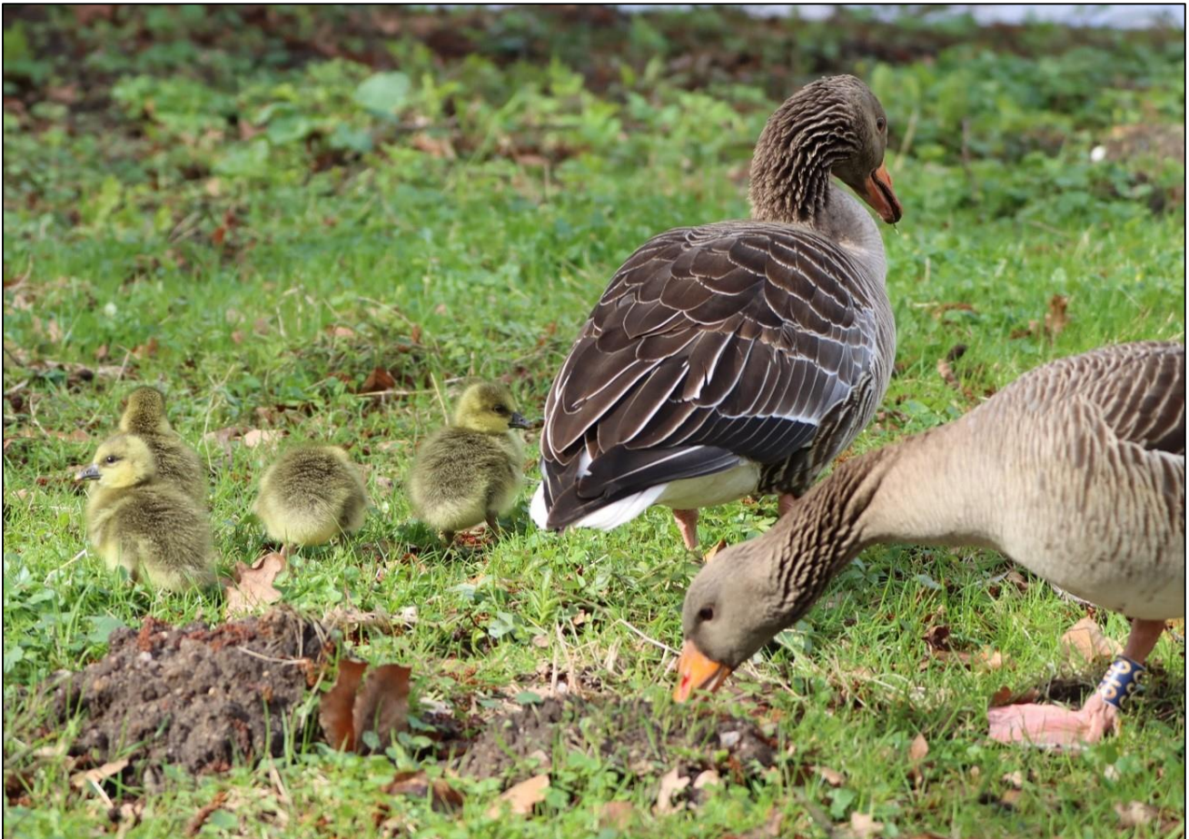
Erste Graugansfamilie Hamburgs in Lokstedt

Am 29. März wurde eine zweite Familie in Steilshoop entdeckt.