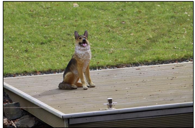
Kunststoffhund und Schnüre zur Abschreckung von Wasservögeln, vorher jahrelang ein wichtiger Rückzugsort für Wasservogelfamilien am Inselkanal