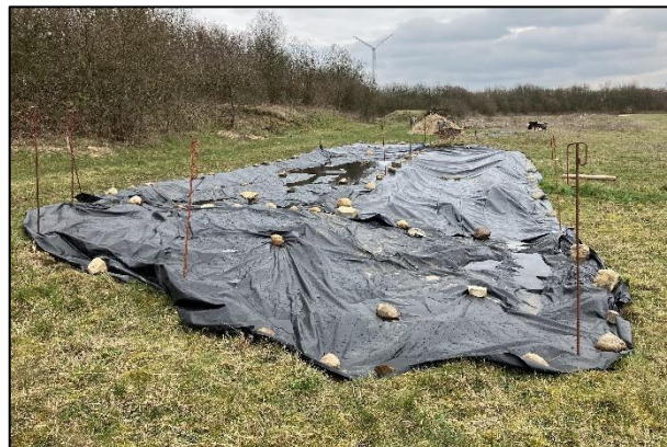
Zum Schutz abgedeckter Bereich

Da es zeitlich und durch Frostperioden nicht zu schaffen war, alle Bereiche vor der neuen Vegetationsperiode fertig zu stellen, mussten wir einen Großteil davon mit Folie abdecken, um zu verhindern, dass dort bodennistende Wildbienen ihre Nester anlegen und diese bei der Weiterbearbeitung der Flächen nicht unnötig zerstört werden.