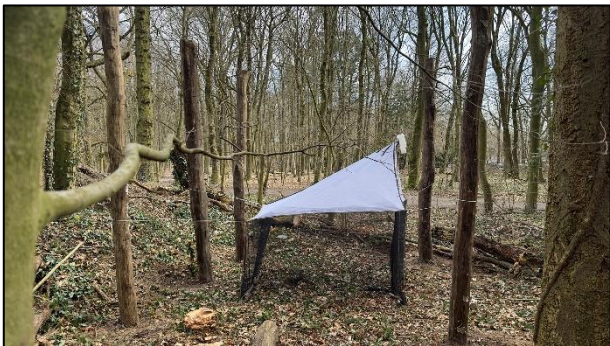
Malaisefalle im Niendorfer Gehege

Plangemäß startete das Monitoring am 20. März in die sechste Saison. Mit dem neuen Untersuchungsgebiet Niendorfer Gehege und den hinzugekommenen Schulstandorten in Eißendorf (siehe Februar-Rundschrieb) sind nun 12 Malaisefallen sowie 31 Bodenfallen im Stadtgebiet im Einsatz.