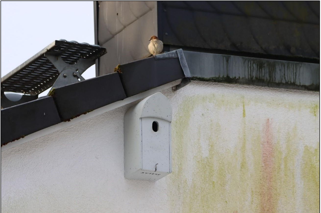
Haussperlingsmännchen bewirbt Nistkasten in Groß Borstel

Wir sind gespannt welche Standorte besiedelt werden und freuen uns über Beobachtungen.